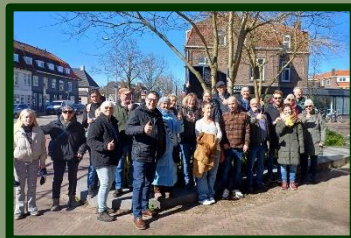
De wandelaars van maart waren enthousiast, dat is te zien.

De kosten zijn: € 12,50 p.p. en de wandelingen duren ± 2 uur (Dat wil zeggen: u loopt ongeveer één uur, en staat stil bij de uitleg van de gidsen. Hun verhaal duurt ook ongeveer een uur.)