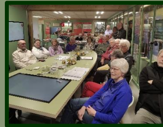
Een beetje behelpen werd het wel, maar de sfeer heeft er niet onder geleden.

museum. Voor deze reünie hadden zich slechts vijf mensen opgegeven, uiteindelijk kwamen er 26.