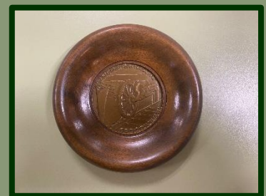
Dit exemplaar werd voorzien van een prachtige lijst om op te hangen.

Ter herinnering aan de grote NS-staking werd later een plaquette geschonken aan de deelnemers, wij kregen deze: