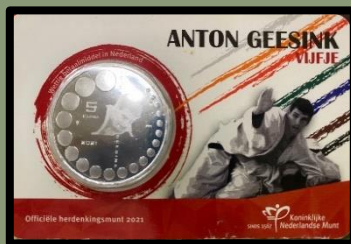
Acht stuks zaten nog in de originele verpakking, waarop Anton Geesink is afgebeeld.