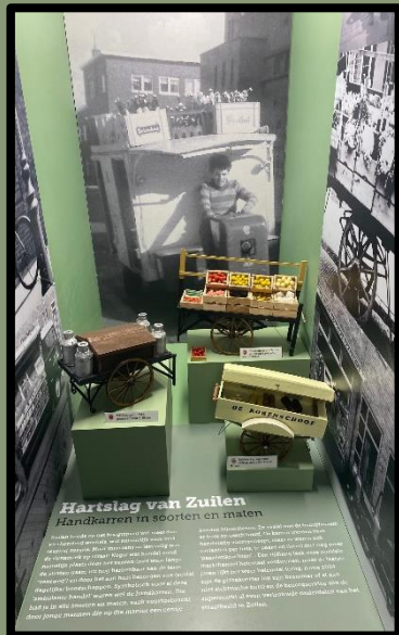
Eén van de vitrinekasten in de Bibliotheek Zuilen.

Het werd al met al deze keer weer eens een dubbeldikke Zuilense Nieuwsbode. Veel te vertellen én veel te vragen! Hopelijk vinden we ook veel gehoor. We kijken uit naar uw reactie. Bij voorbaat dank.