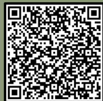
Een willekeurige QR-code uit de historie van het Museum van Zuilen.

Dat is precies de reden dat het museum óók doelgroepen aantrekt die je in andere musea veelal niet tegenkomt. Ook de conclusie van de adviescommissie, dat het museum meer aandacht zou moeten hebben voor diversiteit, inclusie en bereik van doelgroepen buiten Zuilen, is je reinste kolder.