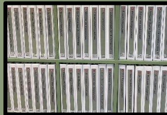
Van alle Zuilense straten een map met informatie, én een PowerPoint-presentatie paraat: uniek! (dit is maar een deel ervan)

Als erfgoedmuseum ligt onze focus op het realistisch en authentiek weergeven van de geschiedenis van Zuilen, het dagelijks leven van de inwoners van de wijk door de jaren heen én de betekenis daarvan voor het heden.