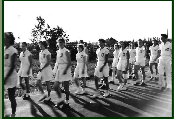
Gymnastiekvereniging Sportief tijdens de avondvierdaagse, juni 1958.

Inclusiviteit is een kernwaarde binnen het museum. Het museum heeft geen idee waar deze opvatting op is gebaseerd, want: