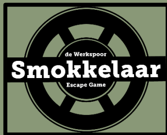
Méer dan vernieuwend: De Werkspoor Smokkelaar Escape Game.

Dit doet het museum op innovatieve wijze, bijvoorbeeld met StraatReünies, QR-stoeptegels, een escape room, de bijna tweewekelijkse uitzendingen van 'U in de Wijk' en ook in de landelijke media krijgt het museum regelmatig aandacht.