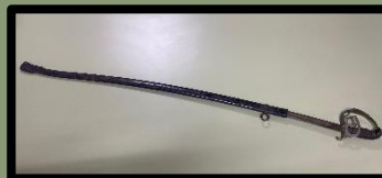
De burgemeesterssabel die bij het ambtskostuum hoort.

Maar... hoe blij we ook waren met het ambtskostuum, er ontbrak wel iets aan, namelijk de burgemeesterssabel. En die maakt het plaatje dus compleet.