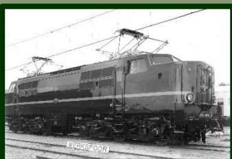
Werkspoor bouwde onder andere de beroemde 1200 locomotieven.

Het Museum van Zuilen is het enige museum in Utrecht dat aandacht besteedt aan de industriële historie van de stad.