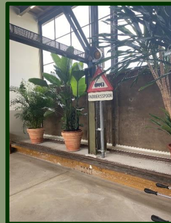
Het is nog even wachten op de schilder, maar ook dat komt goed...