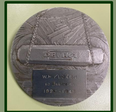
... en na 25 jaar trouwe dienst kreeg hij deze stalen legpenning, een ontwerp van de heer Wienecke: een blok gietstaal in de takels, links en rechts rollen staaldraad en in het midden de fabriek vanuit de lucht gezien.

De collectie van het museum werd ook deze maand weer uitgebreid. En niet alleen met verhalen die er zijn mogen – waaraan trouwens ook heel hard wordt gewerkt door een team van vrijwilligers die heel druk is met het maken van video-interviews voor onze volgende