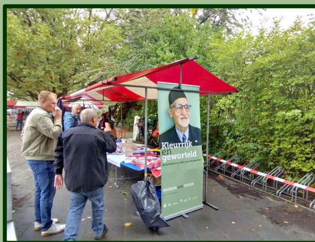
'Onze' kraam op het ZON-festival. Goed bezocht op een uitstekende plek!