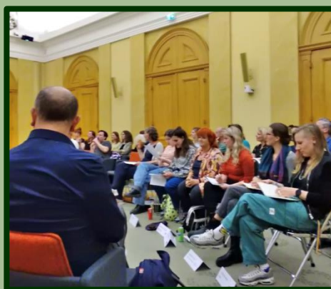
De eerste stap voor de volgende aanvraag voor een bijdrage uit de Cultuurnota is gezet..