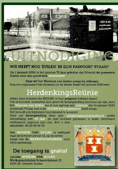
Flyer met uitnodiging tot inschrijving voor de HerdenkingsReünie op 7 januari 2024.