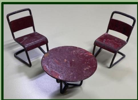
Met vakmanschap en liefde gemaakt: tafel met twee stoeltjes voor de poppen van de kinderen Burghart.