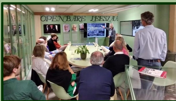
15 familieleden Cahn volgen de presentatie over 'hun' Zuilen van toen.