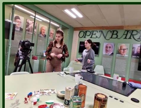
Beide studenten van de SvdJ hebben hun ziel en zaligheid gelegd in het maken van een mooi interview over De Gruyter.