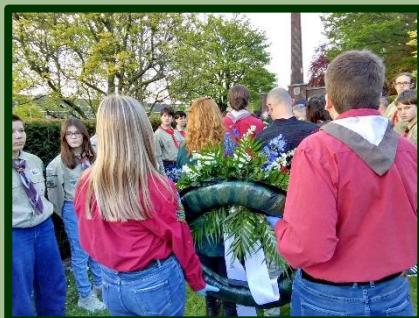
Leden van de scouting droegen de krans tijdens de Stille Tocht.