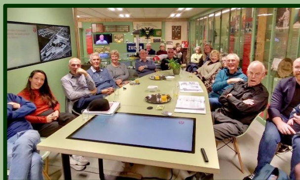
Van oud tot jong, bewoners van de Westinghousestraat.