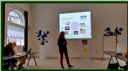
Uitleg in de tuinzaal van het Centraal Museum over de beoogde samenwerking tussen de verschillende Utrechtse musea.