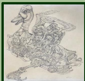
Bijzondere tekening gemaakt door C. Achterberg.