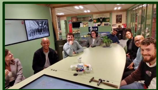
Enthousiaste 'buren' op bezoek.