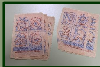
Wie kent ze nog: opstrijkfiguren. Met de strijkbout op je bloesje.

Juist voor onze tentoonstelling, met aandacht voor onder andere De Gruyter, werd een brief bezorgd met vijf 'Snoepjes van de week'. Exemplaren die we nog niet hadden!