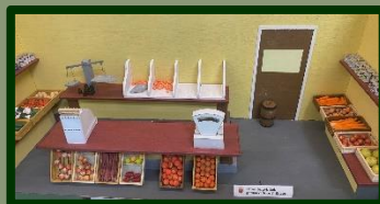
Ook de groentewinkel werd met zorg en liefde gebouwd: zelfs de kroontjes op de tomaten ontbreken niet! Om van te smullen! (nou ja... de aardappelen zijn gemaakt van piepschuim!)