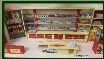
In Utrecht mogen geen nieuwe sigaren winkels gevestigd worden. Maar in het museum staat er toch een.