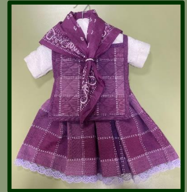
Dit handwerk 'van toen' werd gemaakt door mevrouw Koenen.

door zijn buurvrouw: panelappen, theedoek enz, werden door mevrouw Koenen omgetoverd tot een 'jurkje'.